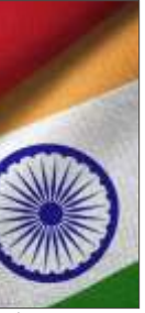
ایم این این

نئی دہلی // ہندوستان اور سوئٹزرلینڈ سرمایہ کاری کے تحفظ کو بڑھانے کے لیے ایک نئے دو طرفہ سرمایہ کاری کے معاہدے پر فعال طور پر بات چیت کر رہے ہیں، جس کی تصدیق سوئس اسٹیٹ سکریری برائے اور خارجہ، الیگزینڈر فاسل نے کی ہے۔ فاسل نے واضح کیا کہ سوئٹزرلینڈ کی طرف سے ہندوستانی کمپنیوں کے لیے موٹس فیوڈ ٹیکنیشن (MFN) کے سلوک کی حالیہ معطلی سے حال ہی میں ختم ہونے والے تجارتی اور اقتصادی شراکت داری کے معاہدے (TEPA) پر کوئی اثر نہیں پڑے گا، جوئی الحال توہین سے گزر رہا ہے اور اس سال کے آخر میں نافذ ہونے کی امید ہے۔ موٹس