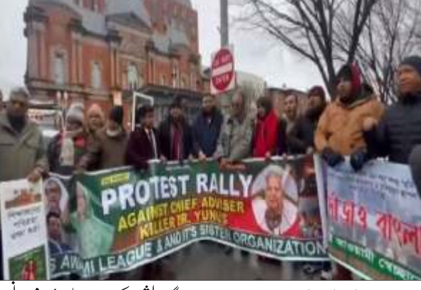
ایم این این

دہشت گردوں کی مدد سے اقتدار پر قبضہ کیا اور شیخ حسین کو بھٹا غیر آئینی تھا، مزید یہ الزام لگا گیا کہ یونس کی قیادت میں اقلیتوں، خاص طور پر ہندوؤں کو نقصان اٹھانا پڑا ہے۔ یہ مظاہرے گزشتہ آگسٹ میں طلبگی زیر قیادت ایک تحریک کے بعد ہوئے جس نے شیخ حسین کو معزول کر دیا، جس کے نتیجے میں نمایاں تشدد اور 600 سے زیادہ اموات ہوئیں، جس کے نتیجے میں یونس کی قیادت میں عبوری حکومت قائم ہوئی۔ یہ مظاہرے بنگلہ دیش میں حالیہ واقعات سے مماثلت رکھتے ہیں، جنہوں نے شیخ مجیب الرحمن کی رہائش گاہ کی توڑ پھوس، ایک ایسا عمل جس کی بھارت نے مذمت کی، ملک کے اندر جاری سیاسی عدم استحکام اور تناؤ کو اجاگر کیا۔