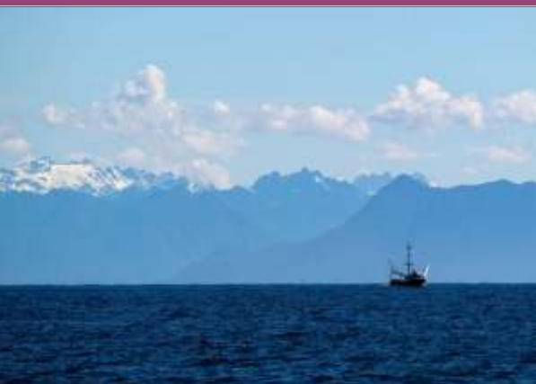
ایم این این

کافی حد تک روکنے کے لیے اپنی صلاحیتوں کو بڑھانے کی کوشش کر رہا ہے۔ فلپائن کے وزیر دفاع گلبرٹو ٹیڈورو جونیئر نے کینیڈا اور نیوزی لینڈ کے ساتھ دفاعی معاہدوں کو نیپالا کی نئی خیال ممالک کے ساتھ اتحاد کو "تیسرے اور مضبوط" کرنے کی کوششوں کا حصہ قرار دیا۔ انہوں نے 6 فروری کو ایک تقریب کے موقع پر صحافیوں کو بتایا، "نیوزی لینڈ کے ساتھ ورننگ فورسز کے معاہدے کی حیثیت... بین الاقوامی قانون کو تبدیل کرنے کے لیے چین کے یکطرفہ پالیسی کے خلاف مزاحمت کرنے کے لیے دونوں ممالک اور کثیر جماعتی ممالک کے اقدامات کا ایک اہم حصہ ہے۔"