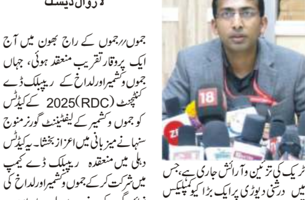
لیفٹیننٹ گورنر منوج سنہا نے کیڈٹس کی کارکردگی کو سراہا، نمایاں کیڈٹس کو اعزازات سے نوازا۔

بزرگوں اور خصوصی افراد کے لیے آن لائن بلیک کا پیکر، نامتعارف، مفت چائے، ٹنگر، مقامی کھانوں میں اضافہ اور ہنگامہ ٹریک کی تزئین و آرائش