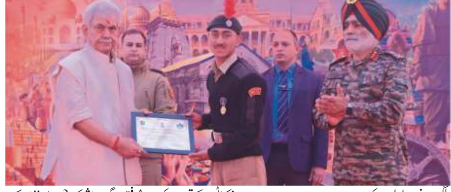
لیفٹیننٹ گورنر منوج سنہا نے کیڈٹس کی کارکردگی کو سراہا، نمایاں کیڈٹس کو اعزازات سے نوازا۔

لیفٹیننٹ گورنر منوج سنہا نے کیڈٹس کی کارکردگی کو سراہا، نمایاں کیڈٹس کو اعزازات سے نوازا