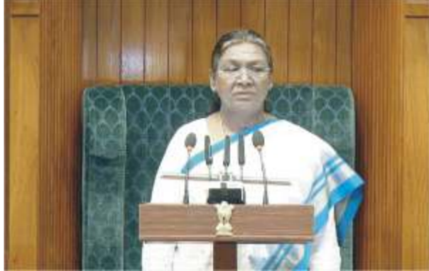
اپنے خطاب کے آغاز میں صدر جموں و کشمیر نے دو ماہ قبل آئین کی تشکیل کی 75 ویں سالگرہ اور 26 جنوری کو ہندوستانی جمہوریت کے 75 سال کے سفر کا تذکرہ کیا اور ہم وطنوں کی طرف سے باصاحب کاغذ پر یادگار 101

آریٹھل 370 بٹائے جانے کے بعد جموں و کشمیر میں ترقی کے لیے سازگار ماحول پیدا ہوا ہے۔ اب ملک کشمیر سے کنیا کماری تک ریلوے لائن سے جڑ جائے گا