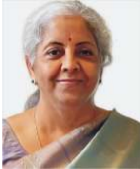
کی پوری کوشش سال 2047 تک ہندوستان کو ایک ترقی یافتہ ملک بنانے کی ہے اور وزیر خزانہ کا پورا زور اس سال بھی گزشتہ سال کی طرح ہی بنیادی ڈھانچے کو ترقی دینے پر ہے۔

بھارتی وزیر خزانہ نریندر مودی نے 2025 کو اپنا آٹھواں بجٹ پیش کر کے ایک نئی تاریخ رقم کریں گی۔ یہ مودی 3.0 حکومت کا پہلا مکمل بجٹ ہے اور بجٹ عام طور پر 11 بجے کو سنا جاتا ہے۔ وزیر خزانہ نے کہا کہ بجٹ عام طور پر 11 بجے کو سنا جاتا ہے۔ وزیر خزانہ نے کہا کہ بجٹ عام طور پر 11 بجے کو سنا جاتا ہے۔ وزیر خزانہ نے کہا کہ بجٹ عام طور پر 11 بجے کو سنا جاتا ہے۔