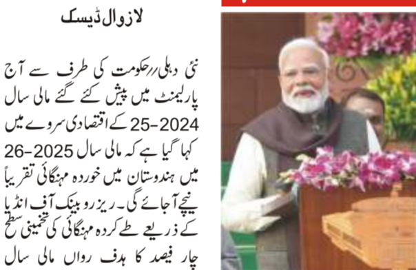
بھارتی وزیر خزانہ نریندر مودی نے پارلیمنٹ کے مشترکہ اجلاس سے خطاب کرتے ہوئے کہا کہ پہلا پارلیمانی اجلاس ہے جس کے پہلے کوئی غیر ملکی چنگاری نہیں اٹھی۔

کہا ملک کے عوام نے مجھے تیسری بار یہ ذمہ داری سونپی ہے اور یہ اس تیسری مدت کا پہلا مکمل بجٹ ہے