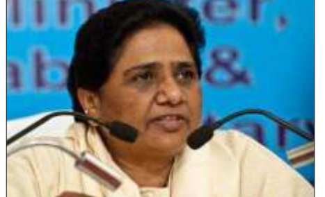
یو این آئی

اور دیگر پسماندہ طبقات کا سرکاری نوکریوں میں سالوں سے ادھورا پڑا ریزرویشن کو کوئی بھی اچھی تک پورا نہیں بھرا گیا ہے۔ خاص کر ایس سی / ایس ٹی سرکاری ملازمتوں کی تقرری میں ریزرویشن کو کافی حد تک بے اثر رہا ہے۔ سابق وزیر اعلیٰ نے کہا کہ بی جے پی کی زرعی پالیسیاں بی بی بی کے لیے ہونے کی وجہ سے کسان بھی سراپا احتجاج ہیں۔ غلط معاشی پالیسیوں سے ملک کی معیشت پر بھی برا اثر پڑ رہا ہے۔ چھوٹا کاروباری طبقہ بھی کافی پریشان ہے۔ ملک کی سرحدیں بھی محفوظ نہیں ہے۔ انہوں نے کہا کہ گذشتہ کچھ سالوں سے مرکز میں ریاستوں میں بی جے پی کی حکومتوں میں ہندوؤں کی آڑ میں مسلم سماج پر ظلم۔ زیادتیوں اپنے شباب پر ہیں جس کی وجہ سے مسلم سماج کی حالت برہنہ خراب ہو رہی ہے۔ مایوسی میں آنے والی نہیں ہے کیونکہ ملک کی عوام سمجھ چکے ہیں کہ ان کی پارٹی نے نذر اور مدلل کلاس کا اٹھنے دن دکھانے کے لئے بھروسے وعدے کئے و دیگر ہوائی دستاویزات گاڑی دی ہے اس کا بھی ایک ذمہ حقیقت میں ایک چوتھائی حصہ بھی پورا نہیں کیا۔ انہوں نے کہا کہ گاہریں پارٹی کو بھی آڑ سے ہاتھوں لیتے ہوئے کہا کہ آزادی کے بعد سے ملک و مرکز کے کافی ریاستوں میں کانگریس اور ان کے معاونین کی ہی حکومتیں تھی لیکن ان کی زیادہ تر معاملات میں غلط پالیسیوں اور غلط کام کی وجہ سے ہی پارٹی کو مرکز و ریاستوں کی حکومتوں سے باہر ہونا پڑا۔ مغربی اتر پردیش میں چھتری سماج کی کافی تعداد ہے۔