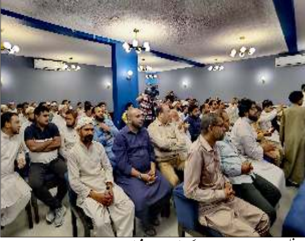
محفل رہی، ایسے افسانے، مضامین اور اشعار تخلیق کرنے کے لئے تخلیق کار کو اسے ہونے سے پہلے کے چراغ کو روشن کرنا محفل نے اپنے مقصد میں فرمایا کہ آج کی محفل ایک بہت ہی معیاری اور شاندار