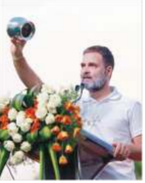
یو این آئی

یو این آئی انہوں نے کانگریس کو نشانہ بنانے والے اپنے حالیہ بیان پر وزیر اعظم نریندر مودی کو نشانہ بنایا۔ انہوں نے کہا کہ آپ نے وزیر اعظم کی تقریریں سنی ہیں، وہ خوفزدہ ہیں، وہ اسٹیج پر آنسو بہا سکتے ہیں۔ بی بی جے پی کی بھارتیہ چومپو پارٹی کے قیام کے مقابلے میں فنڈز حاصل کرنے میں میڈیا قیادت کو اجازت دینا۔ انہوں نے ان کا ایک کراہی کراہی کرنا۔ اس سے پہلے ان میں مسٹر گاندھی نے دہلی پورہ اور بیلاری میں احتجاجی ریلیوں سے خطاب کیا، جہاں