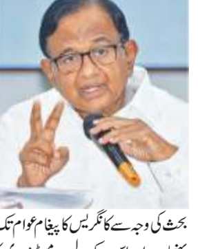
یو این آئی

یو این آئی محبوبہ مفتی کا مینڈی تحصیل کے مختلف مقامات پر روڈ شو جہاں بی بی دھانڈی کرنے کی تاک میں انتخابات منسوی کرنا ایک سازش