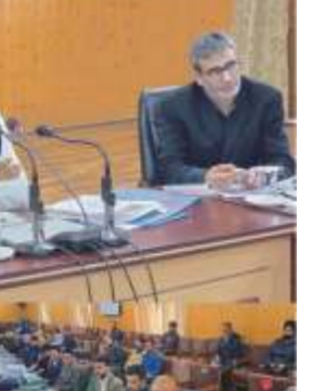
یو این آئی

یو این آئی 'تقدیر سے مشورہ کو ایک نئی تقویت ملی' کانگریس کے انتخابی مشورہ کو ایک نئی سطح کی چہرہ مرم