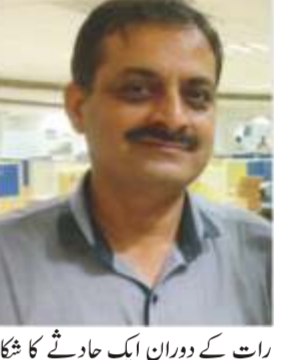
سی بی آئی افسر

لازوال ڈیسک سی بی آئی افسر کی سڑک حادثہ میں موت متحدہ گھونٹالوں کی تحقیقات کر رہے تھے، پولیس نے تحقیقات شروع کر دی